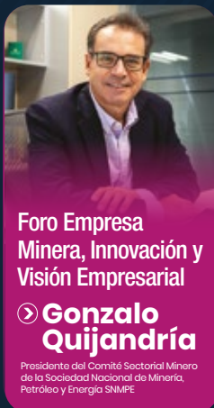
Foro Empresa Minera, Innovación y Visión Empresarial